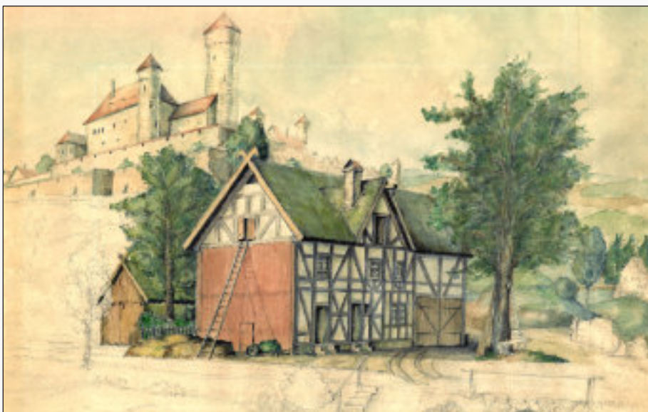
Der alte Böhrlhof am Fuß von Stadt und Feste Nyestadt - (Aquarell Dietrich 1962)

Für den engeren Stadtbezirk wird ein Wasserleitungsnetz gebaut.