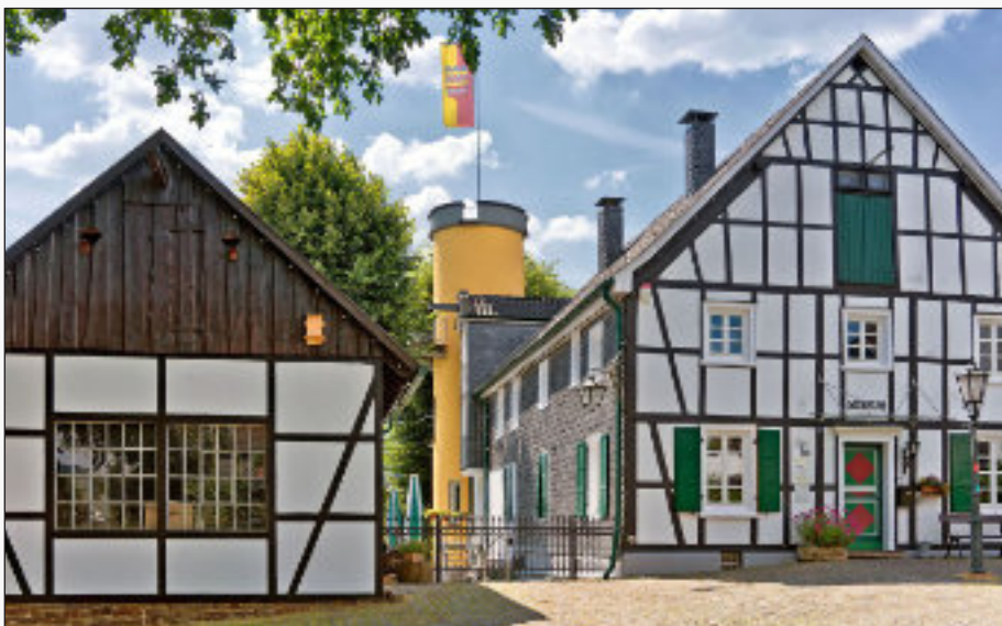
Das Heimatmuseum in der Altstadt

Verlängerung Zubringer Südring von der Othestraße bis zur B55, das größte städtische Straßenbauprojekt (Einweihung am 21. Dezember 1994)