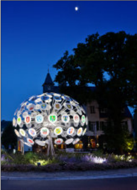
„Pustelbume“ im Kreisverkehr am „Deutschen Eck“