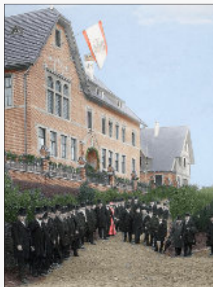
Einweihung der königl. Präparanden-Anstalt, 1905

Eine neue Kommunalverfassung führt zur Aufhebung der Personalunion, in der die Stadtgemeinde Bergneustadt und die Landgemeinde Lieberhausen (Bergneustadt -Stadt und Bergneustadt -Land) verwaltet wurden.