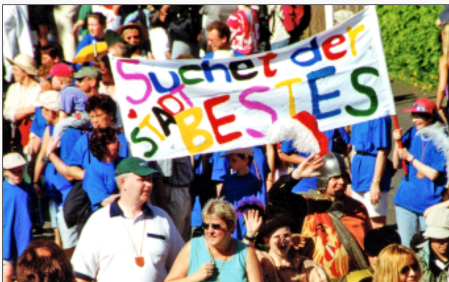
Festumzug zur 700-Jahr Feier

650-Jahrfeier des Schützenvereins im Juni.