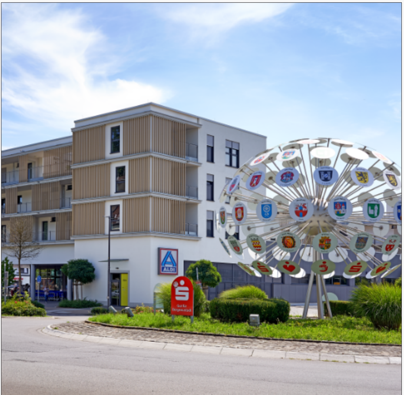
Das neue Stadtzentrum am „Deutschen Eck“