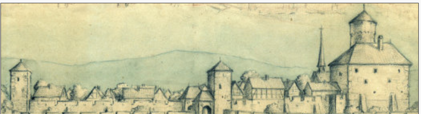
Stadt und Burg im Mittelalter - (Aquarell Dietrich 1949)

Am 30. April Verleihung eines Wochenmarktes und einer Bierakzise an die Stadt Neustadt.