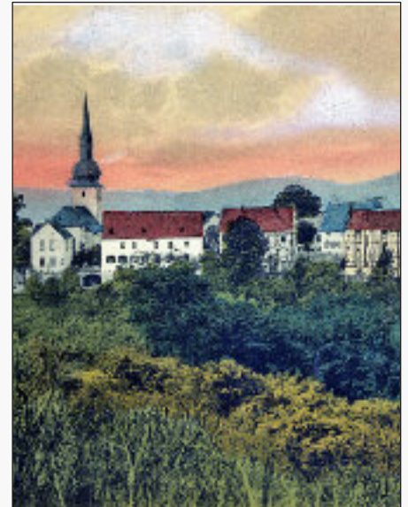
Die Altstadt um 1900

Am 20. September ging wiederum die Stadt in Feuer auf. Durch den Brand wurde das Schloss ebenso wie das Rathaus zerstört.