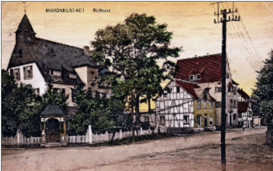
Das neue Rathaus von 1906/1907