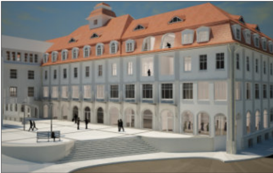
Erweiterung des Rathausplatz und das neue Wohn- und Geschäftshaus

100 Jahre Eisenbahnstrecke Bergneustadt-Olpe. Ende 1979 fährt der letzte Schienenbus von Dieringhausen über Bergneustadt nach Olpe.