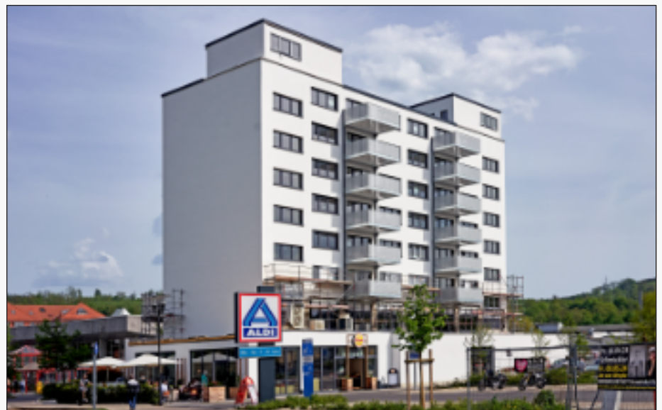
Die neue Innenstadt - Wohn- und Geschäftshaus am „Graf Eberhard Platz“

Die aufgrund eines Verkehrsunfalls im Jahr 2022 demontierte Kunstinstallation am „Deutsch Eck“ erstrahlt zum Stadtgeburtstag im neuen Glanz.