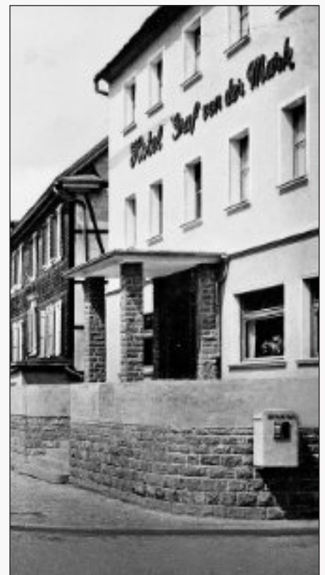
Hotel „Graf von der Mark“

Das Projekt „Stadtumbau Hackenberg“ startet.