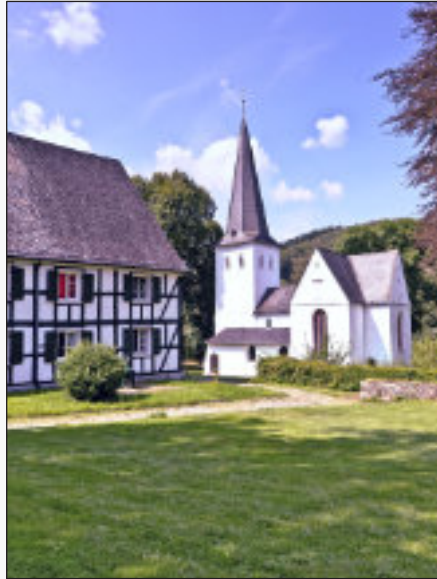
Evangelische Kreuzkirche in Wiedenest