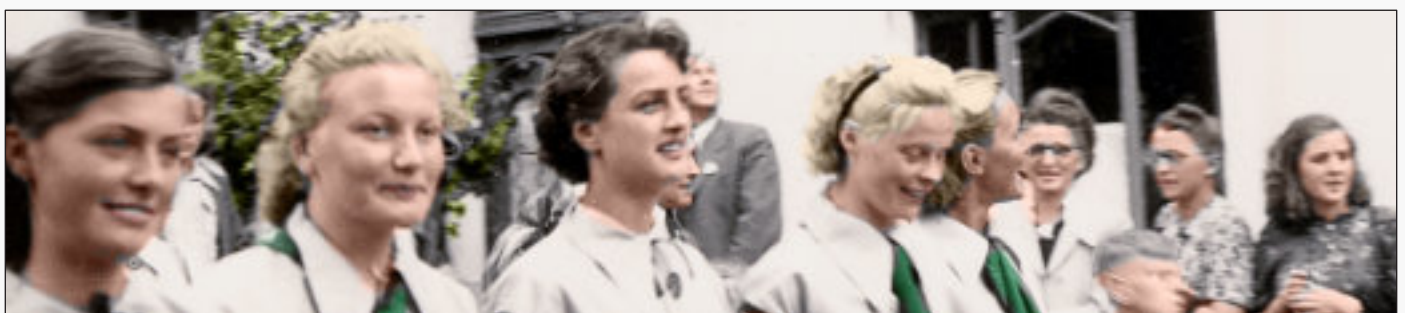
Festumzug zum 650. Stadtgeburtstag 1951

Bergneustadt hat am 27. Februar 10.000 Einw.