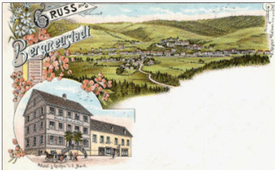
Hotel „Graf von der Mark“ mit angebauter Remise und Saal (Durchgang zum Weg auf den Hackenberg)