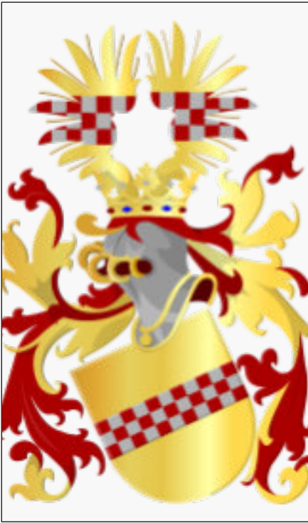
Wappen der Grafen von der Mark