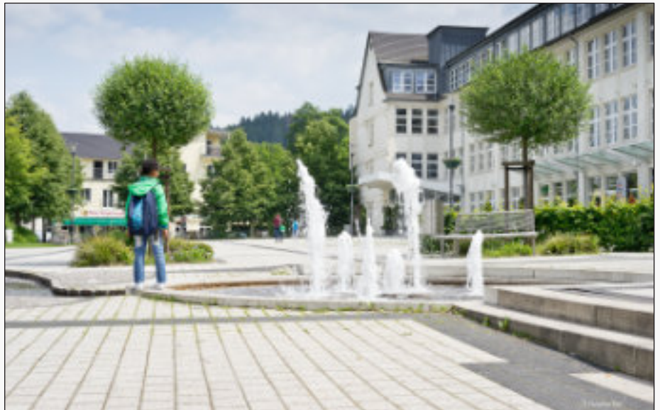
Das neue Rathaus und der Rathausplatz

Bürgerversammlung zum Thema „Städtebauliche Entwicklung unserer Stadt und ihrer Dörfer“.