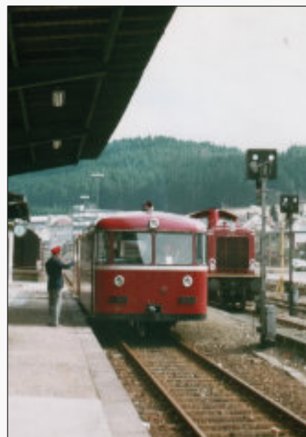
Schienenbus nach Dieringhausen