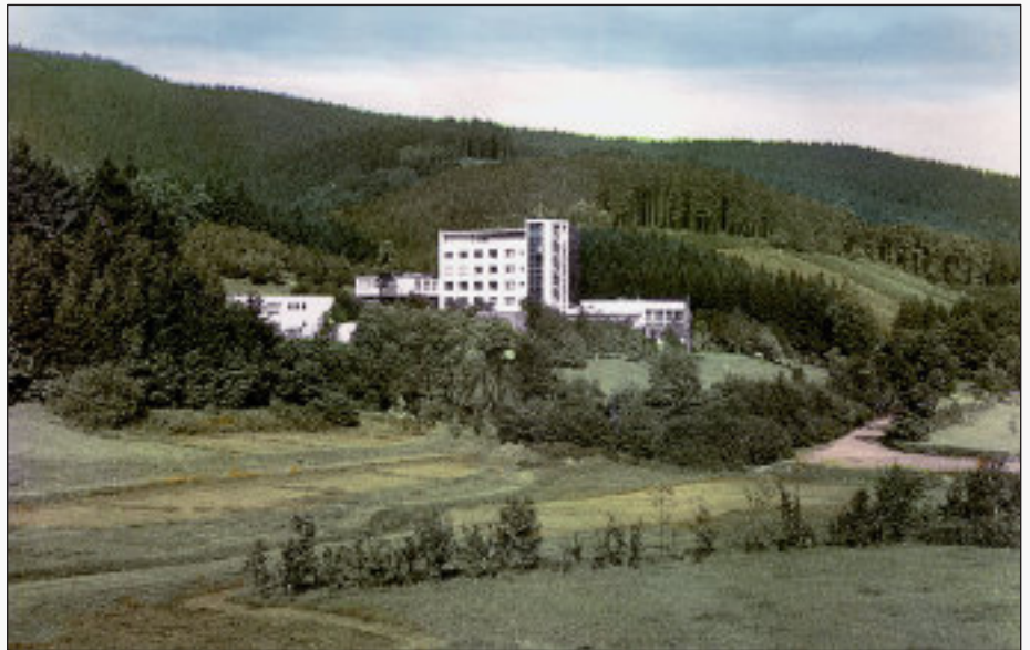
Friedrich-Ebert-Stiftung (1954 eingeweiht, 2004 geschlossen, 2008 Sprengung des Gästehauses)

Im Januar erscheint die 8-seitige erste Ausgabe von BERGNEUSTADT IM BLICK, damals noch „Mitteilungsblatt Feste Neustadt“.